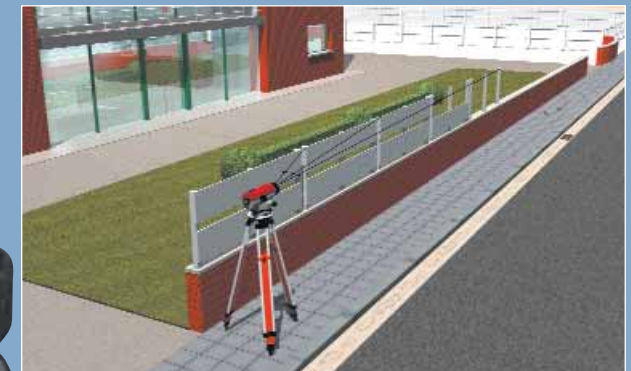
Nivelación de elevaciones con los niveles Pentax serie AP-100